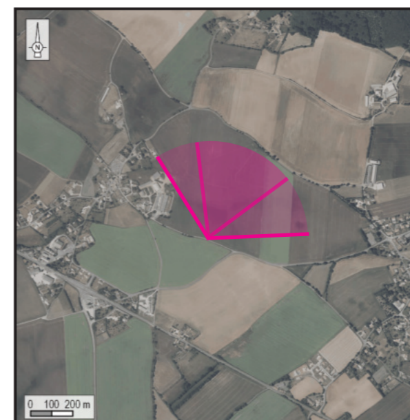
Orthophotographie 1 / 25 000