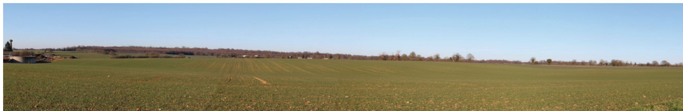
Vue panoramique de l'état initial (angle de vue 120°)